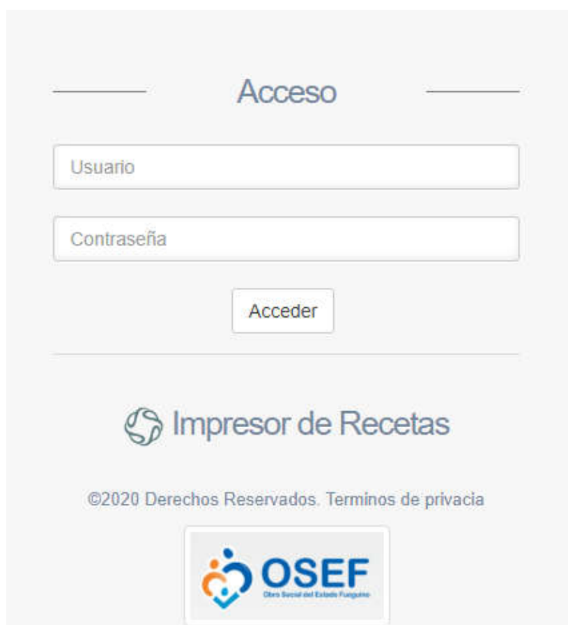
Imagen 1 Página de Acceso

Al visitar el sitio nos encontraremos con la pantalla para acceder al mismo.