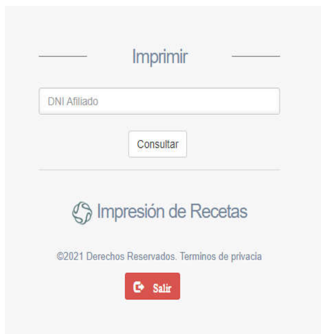
Imagen 2 Pantalla de Inicio

Una vez que hayamos ingresado observaremos la siguiente pantalla.